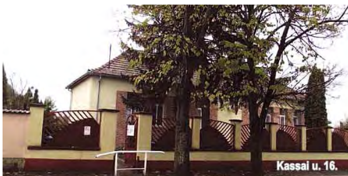
Kassai u. 16.