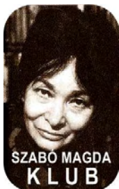
SZABÓ MAGDA KLUB

Beköszöntött az ősz a „nem szeretem” időjárás, azonban ez az időszak több időt ad az olvasni szerető embereknek, ezért könyvtárunkban elindítjuk a Szabó Magda olvasói klubot , melyre várjuk a lakosság felnőtt tagjait.