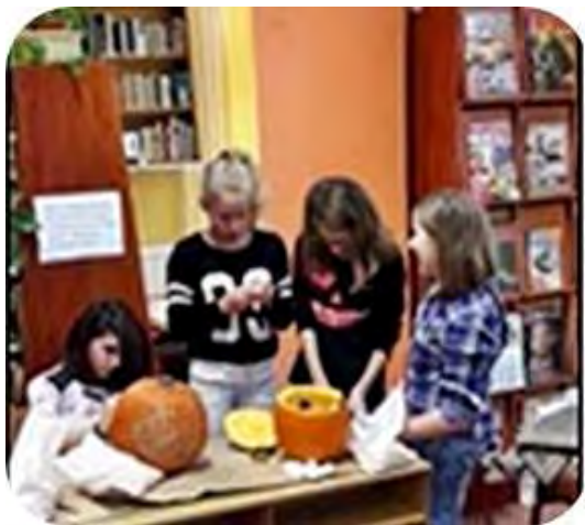
Tökfaragók a vértesi könyvtárban