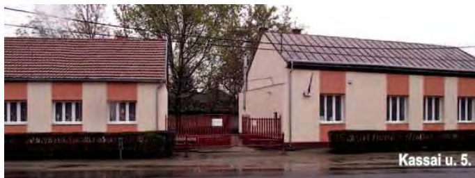
Kassai u. 5.