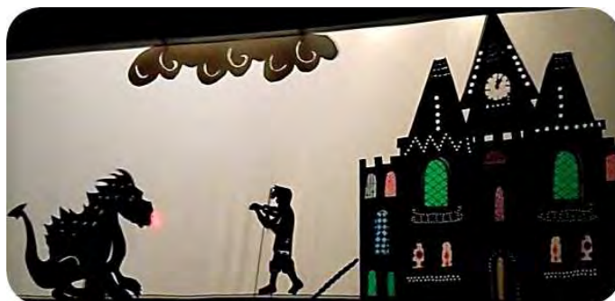
FOTÓK: CIFRA PALOTA BÁBCSOPORT

Ezt követte a 10 éves Cifra Palota bábcsoport legújabb meséjének bemutatása, melynek címe: Az égig érő paszuly .