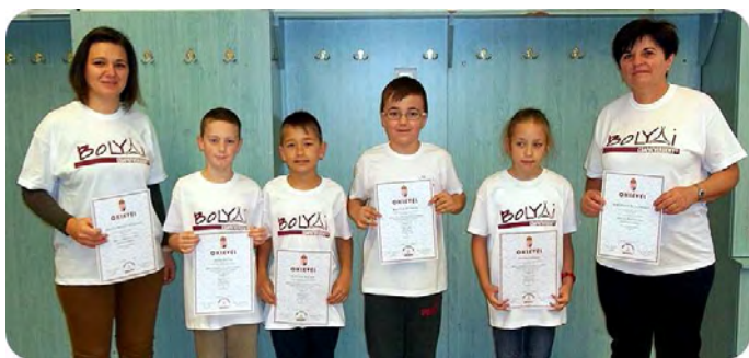
„Torpedó 34” csapatunk

A 2016. október 14-én megrendezett országos Bólyai Matematika Csapatversenyen a harmadik évfolyam Hajdú-Bihar megyei fordulójában 58 csapatból a „Torpedó 34” csapatunk a dobogós 3. helyen végzett. Az ünnepélyes eredményhirdetés október 24-én Hajdúböszörményben volt.