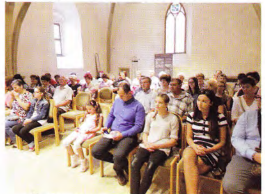
Áhítat a Wittenbergi városi templomban