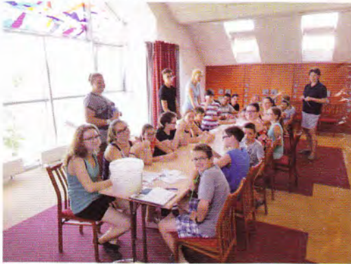
Gyülekezeti tábor - Berekfürdő