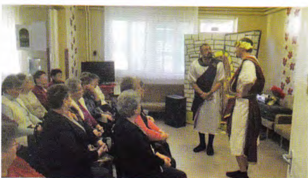
Előadás az otthonban