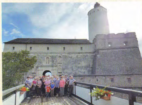
Presbiteri kirándulás – Fraknói Vár