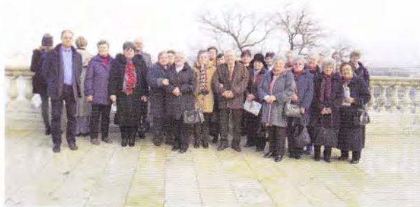
Klubtagjaink, a budai vár előtt...