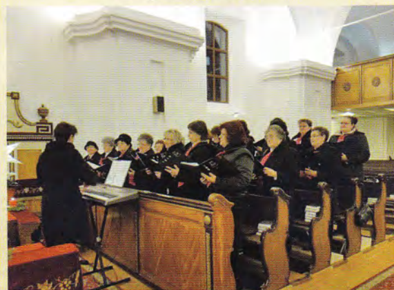
Énekkarunk adventi zenés áhítata