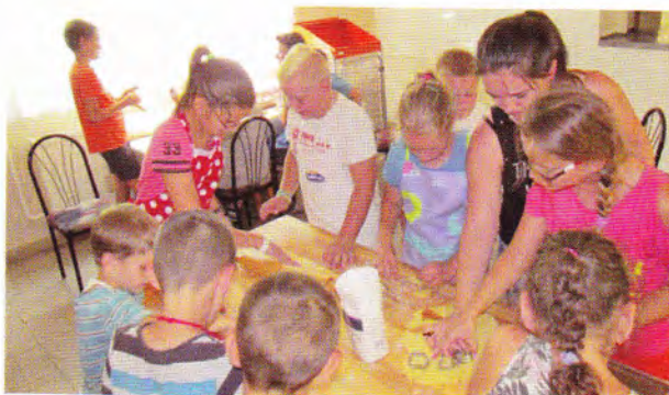
Nyári „Mosoly tábor” a dolgozók gyerekeinek