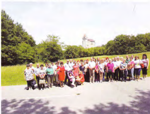
Gyülekezeti kirándulás – Liechtensteini vár