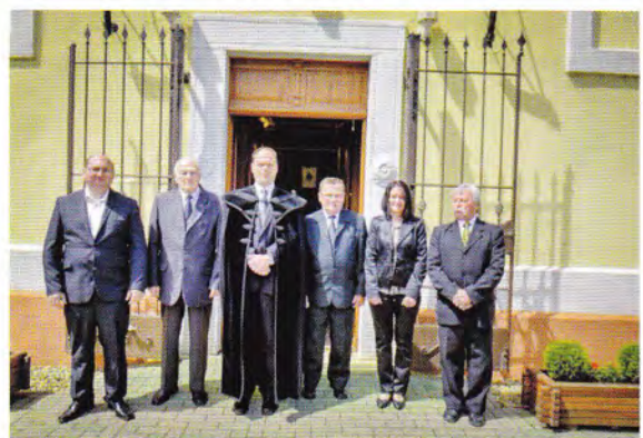
25 éve konfirmáltak