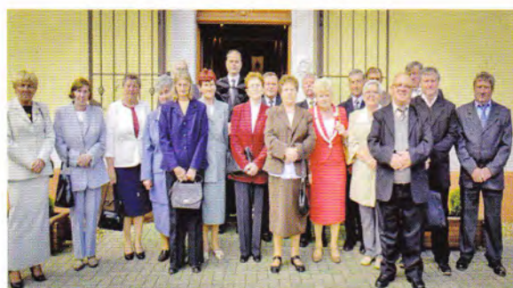
50 éve konfirmáltak