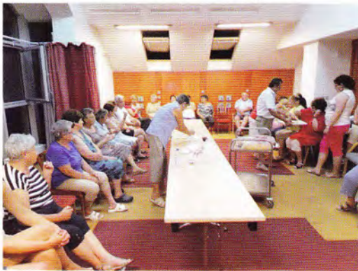
Gyülekezeti tábor - Berekfürdő