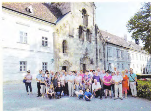
Presbiteri kirándulás – Heiligenkreuzi Apátság