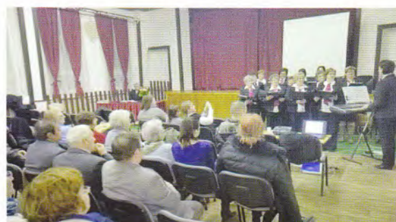
Énekarunk szolgálata a kokadi evangélicáción