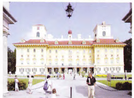
Kismarton – Eszterházy kastély