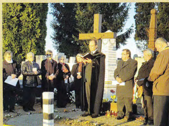
Megemlékezés a temetőben