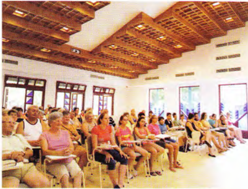
Gyülekezeti tábor - Berekfürdő