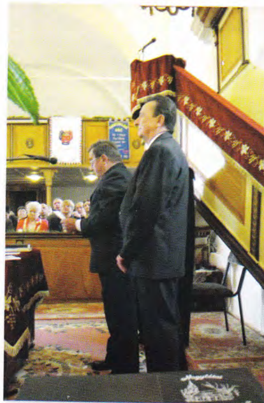
A képek a konfirmáción készültek