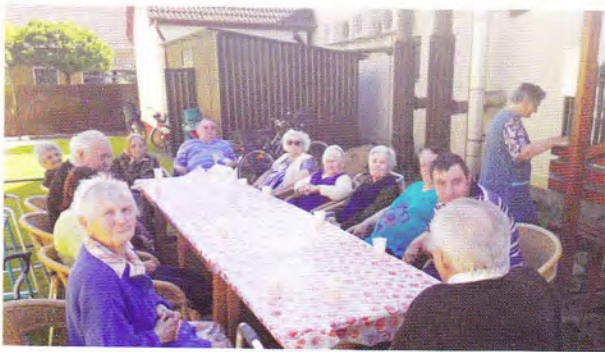
Bográcsoszás az otthonban