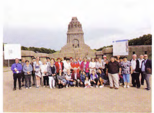
Lipcse – népek csatája emlékmű