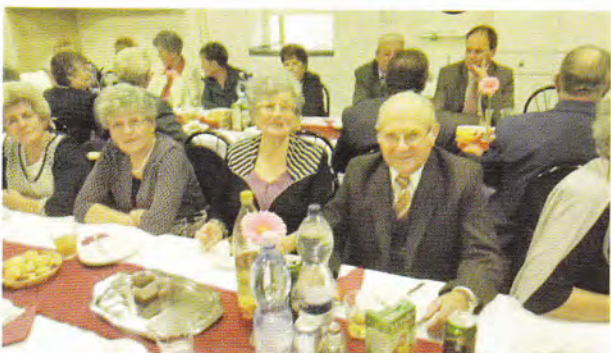
Klubos idősek napja