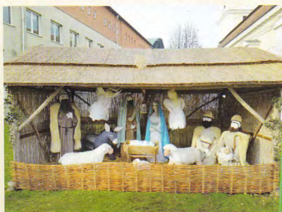
A nagylétei „Betlehem”