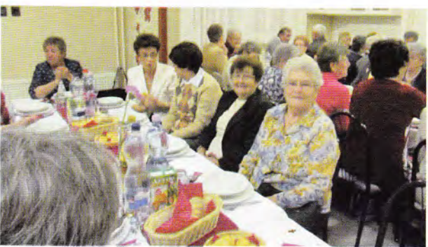
Klubos idősek napja