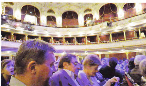
...és az operett színházban