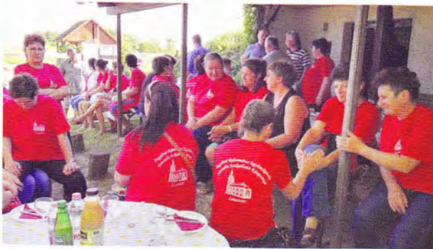
5 évesek lettünk!