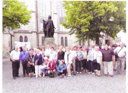
Lipcse – Szent Tamás templom