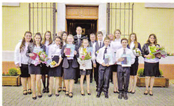
2016-ban konfirmált ifjaink