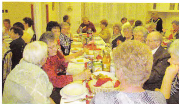
Klubos idősek napja