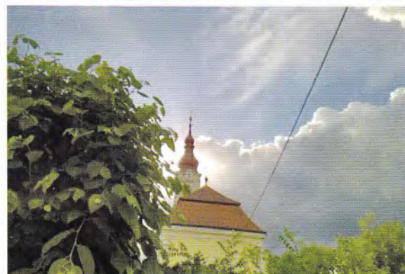
„Itt van Isten köztünk, jertek őt imádni Hódolattal elé állni.”