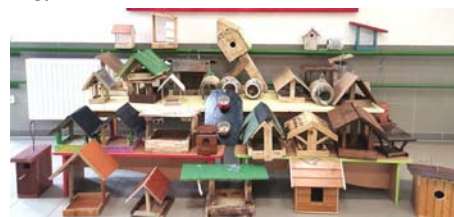
FOTÓK: GYERMEKSZIGET ÓVODA-BÖLCSŐDE

A Létavértesi Gyermeksziget Óvoda-Bölcsőde már rendelkezik a Zöld Óvoda Címmel és távlati céljaink között szerepel a Madárbarát Óvoda cím elnyerése. Az intézményünk természeti környezete, fás, bokros udvara rendkívül alkalmas a kitűzött célunk megvalósítására. Ez jól illeszkedik a törekvéssel, amelyet napjainkban tapasztalunk, hogy a környezettudatos magatartás, a környezettudatos szemléletformálás, fenntarthatóságra nevelés milyen nagy hangsúlyt kap napjainkban. A környezettudatos szemlélet formálása már kisgyermekkorban elkezdődik. Ez az óvodai nevelésben mindig is jelen volt. Ezért is hirdettük meg a szülők számára az otthoni barkácsolás keretében madáretetők készítését. Felhívást intéztünk ügyeskező apukák, nagypapák, nagybácsik részére.