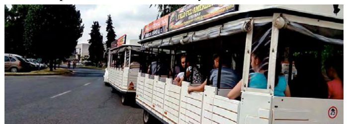
Folytatás a 12. oldalon

Ingyenes kisvonatozás volt 9 – 16 óráig az Árpád téri református templomtól induló szerelvénynel.