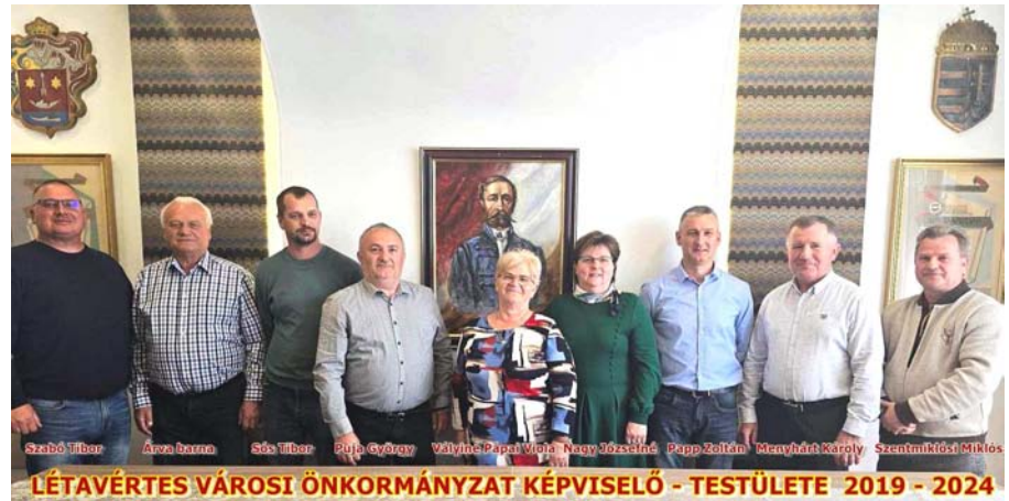
LÉTAVÉRTES VÁROSI ÖNKORMÁNYZAT KÉPVISELŐ - TESTÜLETE 2019 - 2024