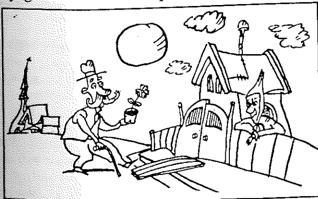
Asszony, visszakaptam a földet ... !

Összességében a Polgármesteri Hivatal az ügyfeleknek minden esetben tudott segíteni és megnyugtatóan rendezte a kárpótlási eljárásukat.