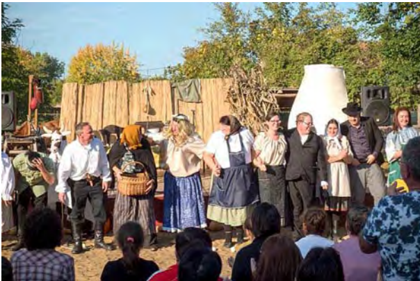
Kövári Krisztián képei a Letavertes Város Önkormányzata facebook oldalán

A „ Lóra született a magyar ” című hagyományörző műsorunkban a magyar nép lovas történelméből mutattak be lovasaink, lovas barátaink részleteket. A hagyományörző szekeres szüreti felvonulókat a Villongó néptáncsoport és a Zimberi banda közreműködésével mutattuk be.