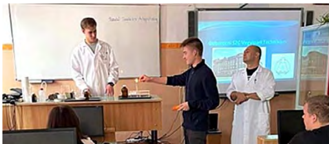
Pillanatképek a Vegyipari technikum bemutatójából

Látványos kísérletek bemutatásával népszerűsítették diákjaink körében intézményüket a Debreceni SZC Vegyipari Technikumát képviselő tanulók és az őket kísérő pedagógus.